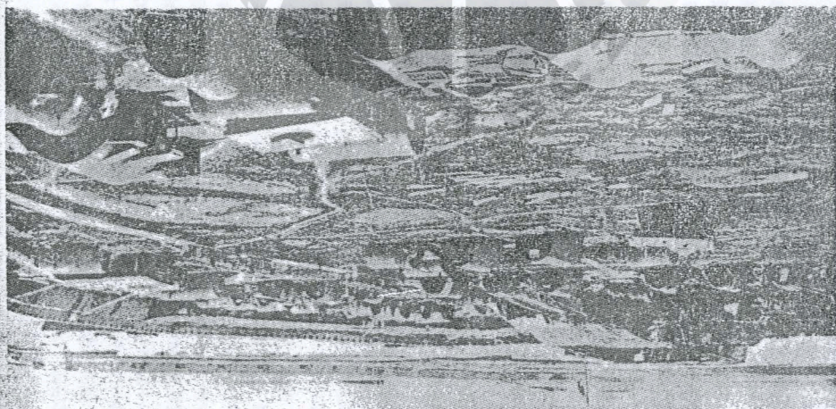
。揚飄在旗國的國英着掛懸上台炮，營軍的台炮沽大在軍英，後陷失台炮沽大