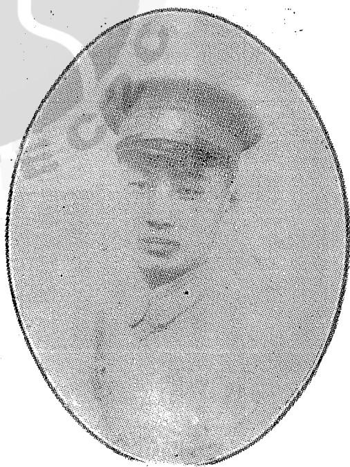
。相照的時業畢校軍埔黃軍將才家喬者作「集然浩」（右） （頁三十八見文）。影合志同作工與時山行太戰苦軍將才家喬（左）