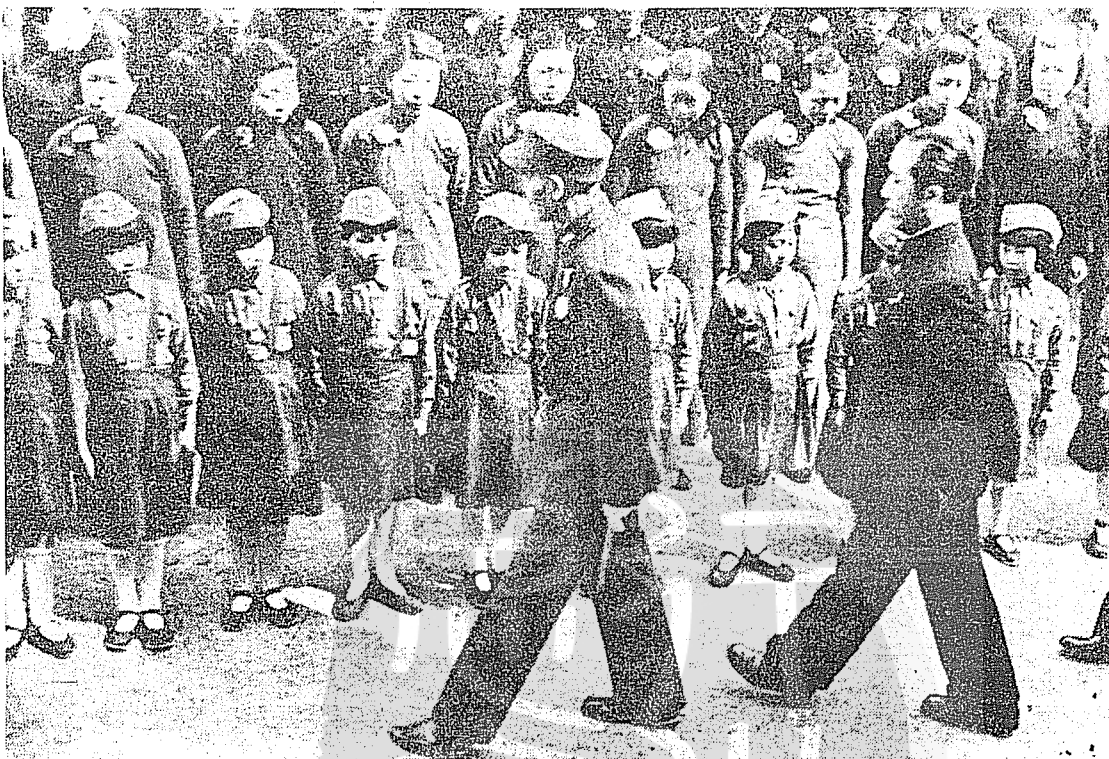
喬家才「爲戴笠辯誣」插圖 戴笠將軍（右後）隨侍蔣委員長慰問革命先烈遺族。（文見七十頁）