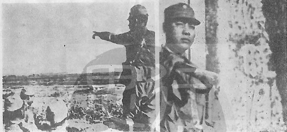
。士戰勇英的橋溝蘆土國衛守立站邊旁「月晚溝蘆」(右上)