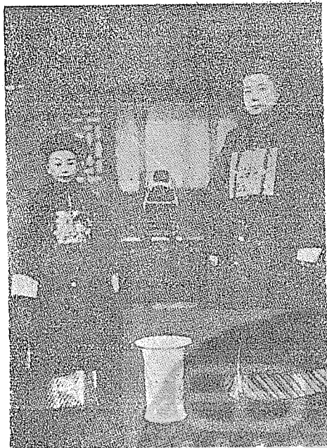
滿清幼帝宣統(左)和攝政王載灃。

國父就任臨時大總統，就是彌補這個弱點。但是他的在職期間是有局限度的，那就是「專制政府既倒……」等條件。這正暗示袁世凱說：「革命軍已經有整個指揮系統，有力量消滅滿清政府，如果袁世凱能推倒滿清政府弭平國內戰爭，孫先生可以把總統職位讓給袁世凱。從這個誓詞看，這是進可以攻，退可以守的高等政略，南北和議之門未閉，袁世凱做總統的希望仍在。但袁世凱對國父就任臨時大總統一事，誤以為希望幻滅，乃