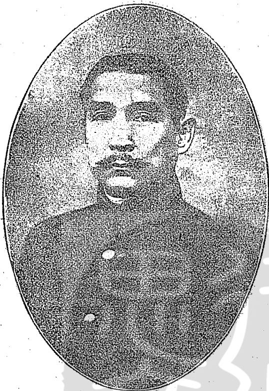
民國元年自歐返國被推選爲中華民國第一任臨時大總統的孫中山先生。

，是馮國璋的首功，隆裕太后因而特予召見馮亦感激涕零，認爲革命軍掃平極易，他願盡全忠，力任此事。事聞於袁世凱，大爲震怒，便把馮國璋的部隊，易以段祺瑞所部，停止對武昌的進攻，派劉承恩南下，商談停戰議和。革命軍方面認爲劉承恩不够資格，要袁世凱換派大員商談。時東南革命軍已組織聯軍，