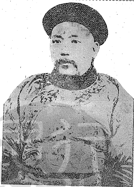
(上圖) 假惺惺效忠滿清政府的袁世凱，壓迫孤兒寡婦取得政權。

在政治地位上，當時僥倖成功，不論黎元洪也好，袁世凱也好，他們在歷史上只留下一個千載的惡名。尤其是袁世凱，他一心一意的要做皇帝，但是他的洪憲短命皇朝，只是在新華宮做了幾十天的惡夢，他面對全國國民的唾罵和各方面聲罪致討的軍事行動，連他的心腹將領陳宦都反對他，但他還想廢棄皇帝而重爲總統，被護國軍總司令蔡鍔罵他這是「再醮之婦重歸宗祧」的蠢到極點的想法，萬萬辦不到，