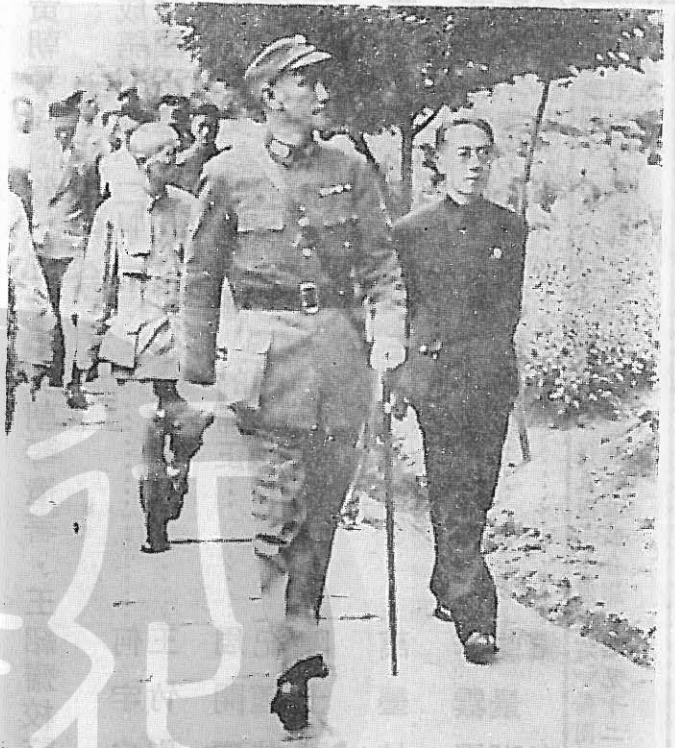
公介長校蔣同陪(右)放天程(左)夫果陳期時戰抗 。影留學大治政視巡(中)