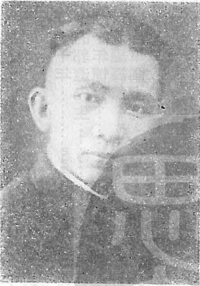
在成守袁者作天夏年一十二國民 相照的時業畢期一第部學大校政。