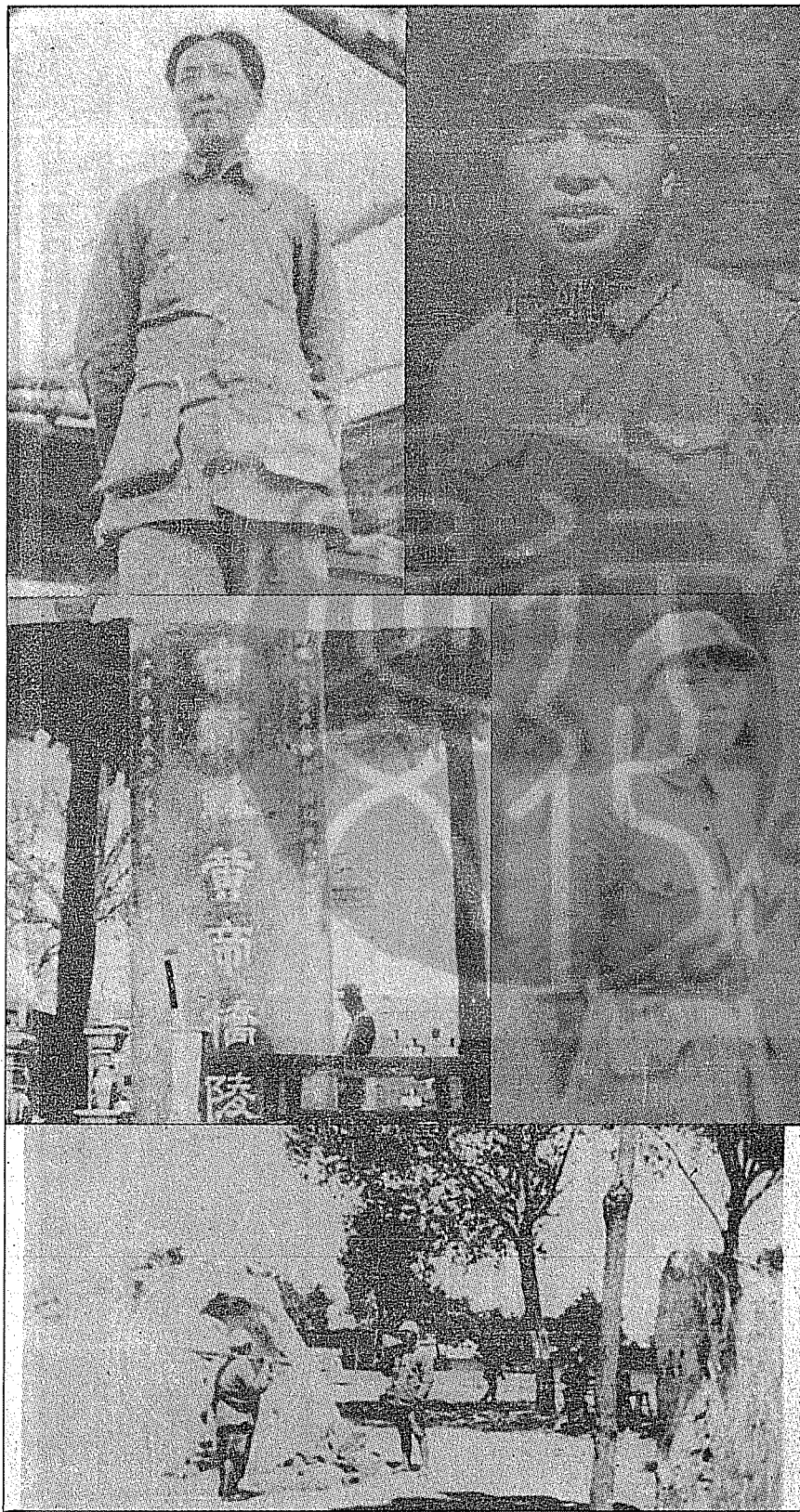
(上圖)左：面帶恭順，內藏奸詐的毛澤東。右：任陝、甘寧邊區紅軍「前敵總指揮」時的彭德懷。 (中圖)左：中央視察團赴延安過中部縣祭陵。右：偽政協副主任、朱德的妻子康克清。 (下圖)：毛首澤東延安住所，樹下是窯洞、左邊是衛兵及哨棚。