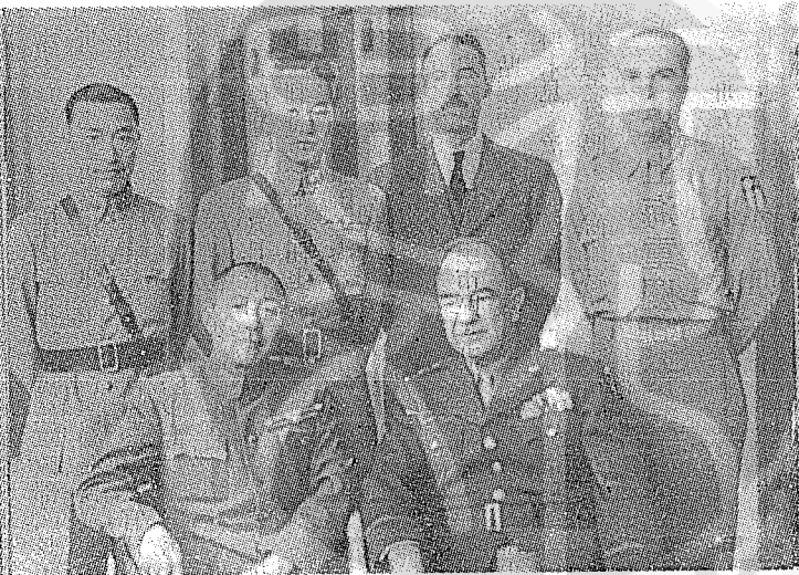
民國三十四年錢大鈞將軍（前排左）在重慶與美國駐緬甸軍司令李爾梅將軍（前排右）合影，後排左二為孫立人將軍。

北伐完成，全國統一，政府決意整軍，分區編遣，將軍任第一編遣區主任；所部首先縮編為整編第三師；仍回任師長，駐京滬一帶。十八年春，將軍調任國民革命軍總司令部總參議，追隨先總統 蔣公西征平亂，將軍奉命接收第四集團軍隨營軍官學校，改稱中央陸軍軍官學校武漢分校，將軍任教育長。（教育長即今日之校長，當時