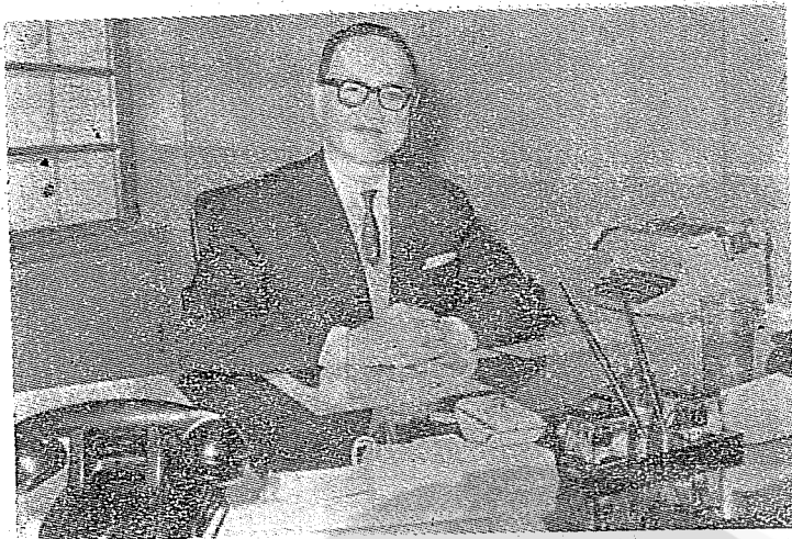
、長事董社訊通央中、長事理會協育教播傳衆大國民華中 。相照的授教野星馬者作文本

七月二日，是我敬佩的友人黃天鵬先生逝世百日紀念。我因爲同一時間到木柵政大出席一個會，所以沒有參加天鵬兄紀念座談會，哀我故人，悲悼無已，只把我所認識的天鵬兄精神，簡述如下：