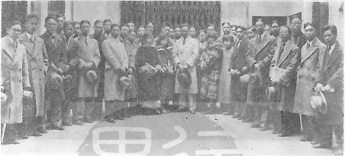
（頁九〇一見文）圖插「行異的孫子凱世袁」

右中、翔志馮左中，報申觀參生學系聞新學大旦復領率（中排前）投教鵬天黃年九十國民 。（頁九第見文）忠名何