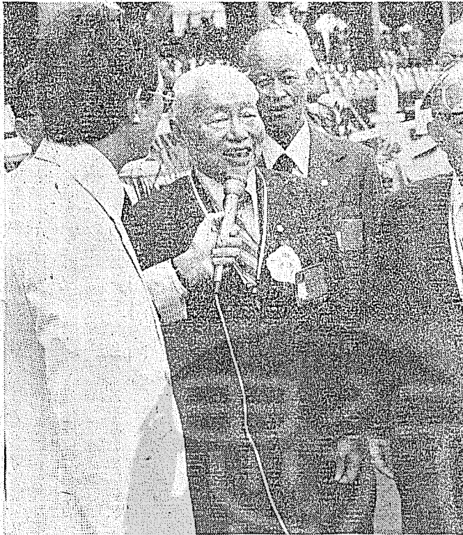
龔浩將軍本年雙十國慶向記者發表談話時留影。

賀勝橋有河橫亘，寬數百米，水深不能徒涉，吳佩孚聞汀泗橋失利，親自前往督戰，馳抵賀勝橋，見潰兵塵集，冀憑河阻絕，藉以挽回戰況，扼守橋頭，手刃潰官十數，懸首電桿示衆，無奈潰兵愈集愈多，一部投河競渡，浮屍滿江，慘不忍睹。該河反變我包圍堵絕，皆由我四、八兩軍乘勝猛追，迫不及待，祇得向我軍紛紛投誠繳械，第四軍俘獲最多，幾以萬計，此爲賀勝橋大捷，爲余親自所見。吳佩孚自此退守武漢，以武昌、漢陽爲據點，以劉玉春爲武昌守城總司令，督軍陳嘉謨副之，以高汝桐爲守陽夏總司令，吳本人坐鎮漢口，調度各方。惟守武漢雄城核心兵力，一爲收容援湘殘部，納入武昌堅城；一爲新由河南增援各部，配屬地方軍，佈防陽夏，實已勢絀途窮。原有北方武力，被牽制於南口，與馮玉祥國民軍作持久之對抗。吳佩孚百戰英名，皆因緣時會，系統龐雜，徒有虛聲，余曾在洛陽考察，見吳治軍無組織、無訓練，書生狂大，頭腦陳腐，至此已無可用之兵；回觀我北伐之師，有新領袖，有新主義，有新部隊，有新戰法，用所長，避所短，一勝再勝，愈戰愈強，不成對比，吳佩孚總崩潰快欲臨頭，可預卜矣。 武漢爲中國腹心，水陸交匯，物資輻輳，確爲戰略上之大樞紐，今守核心，已是技窮自滅。