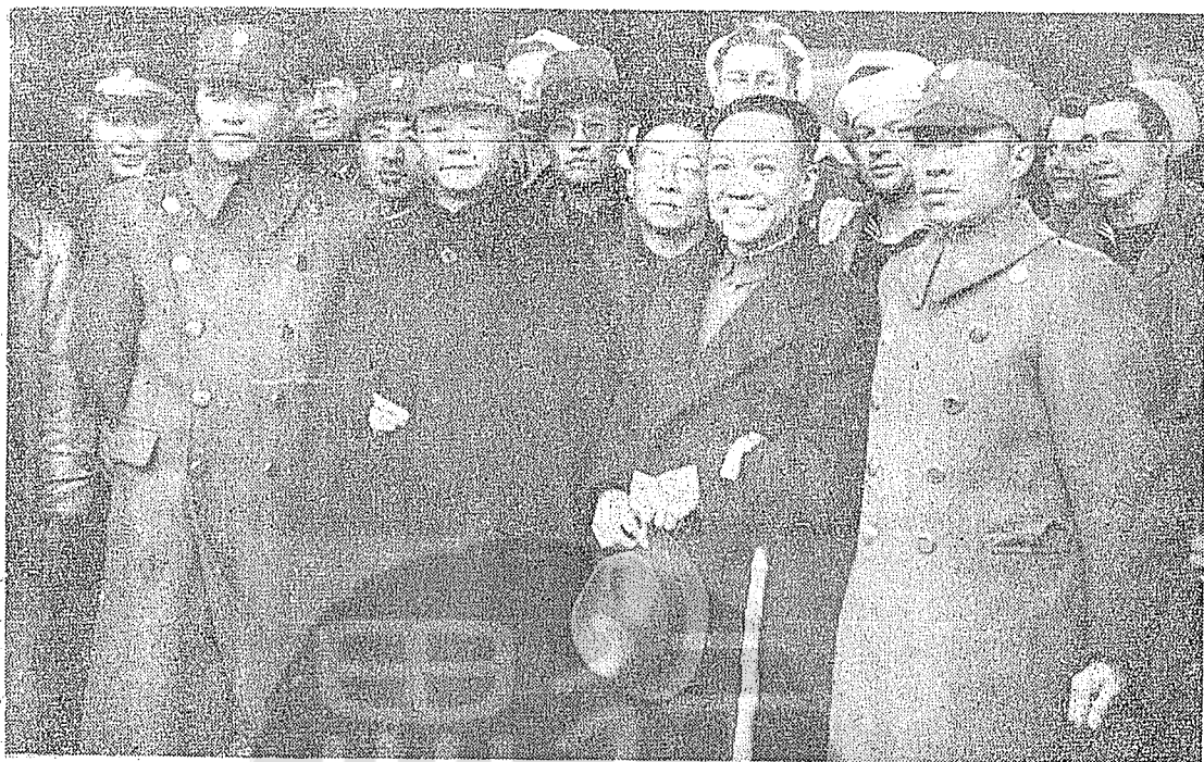
國勞慰津天抵飛生先綱正谷同陪（二左排前）軍將寒衷賀利勝戰抗年四卅國民 。生先綱正谷為二右排前，影合員人迎歡與軍

「他謙遜地說：近四、五年來，因為職務上的關係，沒有時間從事有系統的學術研究，現在承賀部長讓他暫卸行政上的仔肩，調他任設計委員，能有時間來從事學術上的研究，非常感覺快慰！」