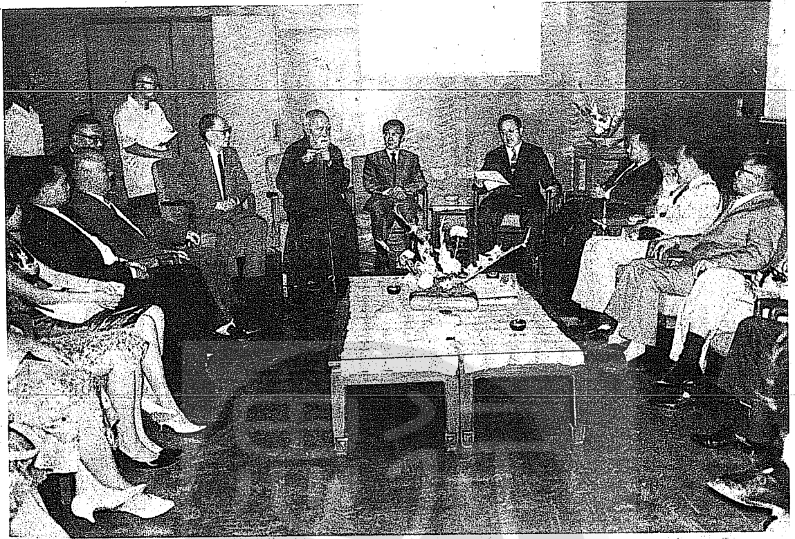
。士博琦景莊為四右長院任右于會拜團華訪員議巴沙年四六九一