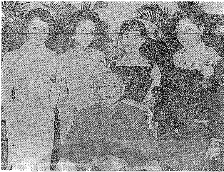
(上) 先總統 蔣公接見香港自由影劇界回國勞軍觀光團代表左起：葛蘭、白光、林黛、李湄。 (下) 香港戲劇界回國祝壽團由胡蝶、陳燕燕領隊與今總統蔣經國夫人(前排右六)合影。