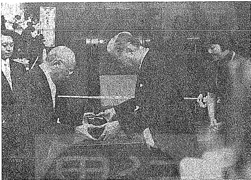
本文作者（左）贈送總統蔣公佩劍，由產經新聞社長鹿內信隆（右二）接受。

是中華民國革命軍人義無反顧的象徵，更是總統蔣公仁義之師的光榮標誌。說明「蔣公佩帶此劍，整軍經武，安內攘外，實現了他「智、信、仁、勇、嚴」的軍人武德，與仁愛忠恕的政治理想，希望日本人士，永遠珍視這柄「仁者之劍」。