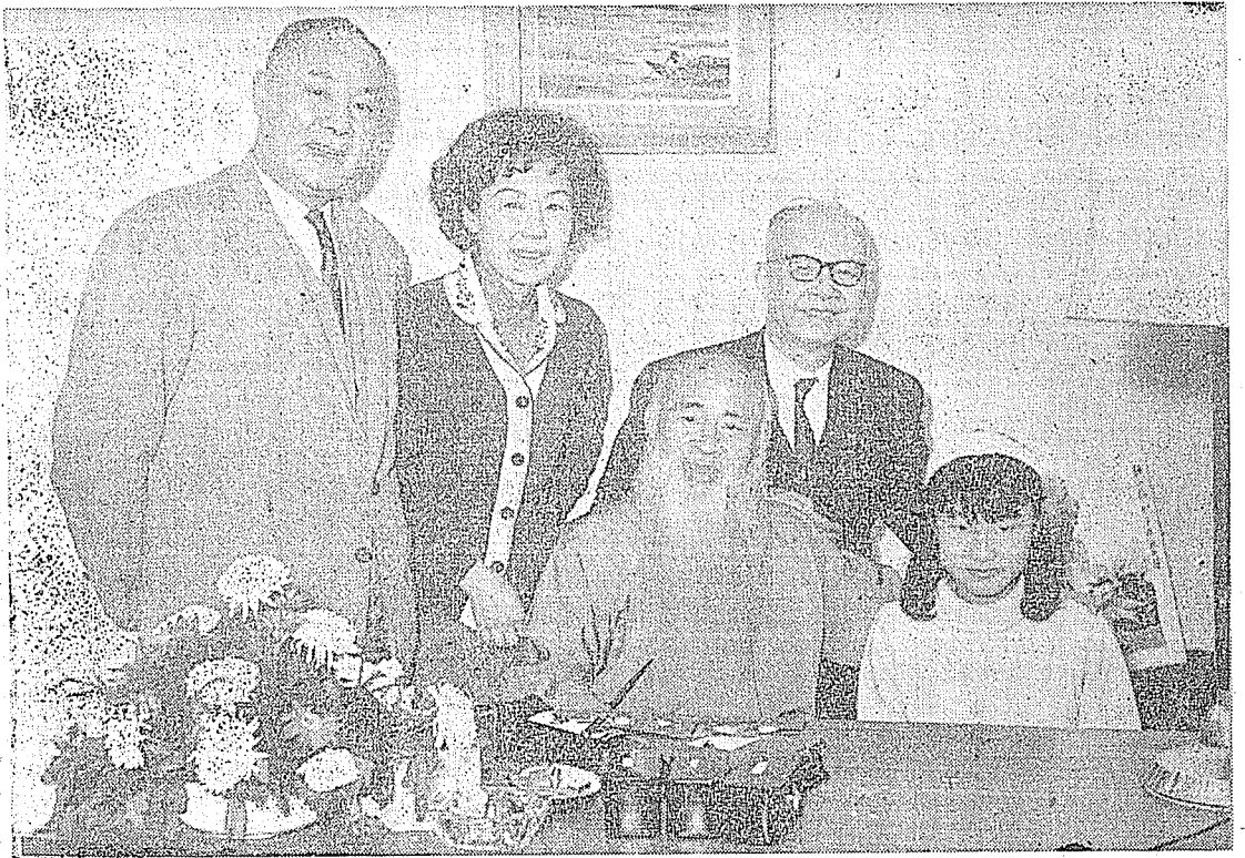
(左)冰應溫婿女(中)鷗易子公女偕年早(右排後)左君易人詩國愛 。影合千大張家畫與(右排前)珠慶溫女孫外

，白居易詩之自然，兼具白話詩的風格。時正日軍入侵，國難當前，故作者感慨特深。序中有云：「嗟呼！關山淪陷，中原已有風聲鶴唳之驚；志士悲愴，午夜如聞寶匣龍泉之嘯；豈僅傳一奇女而已哉！」