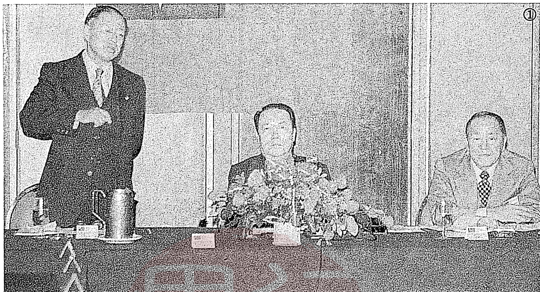
①1979年汪彝定(中)任經濟部政務次長時，訪問南美哥倫比亞，左立者為駐哥倫比亞大使沈錡、右為邵學鋨局長。