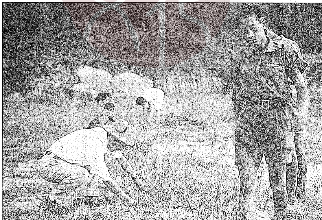
②戴笠（左）參加勞動服務。