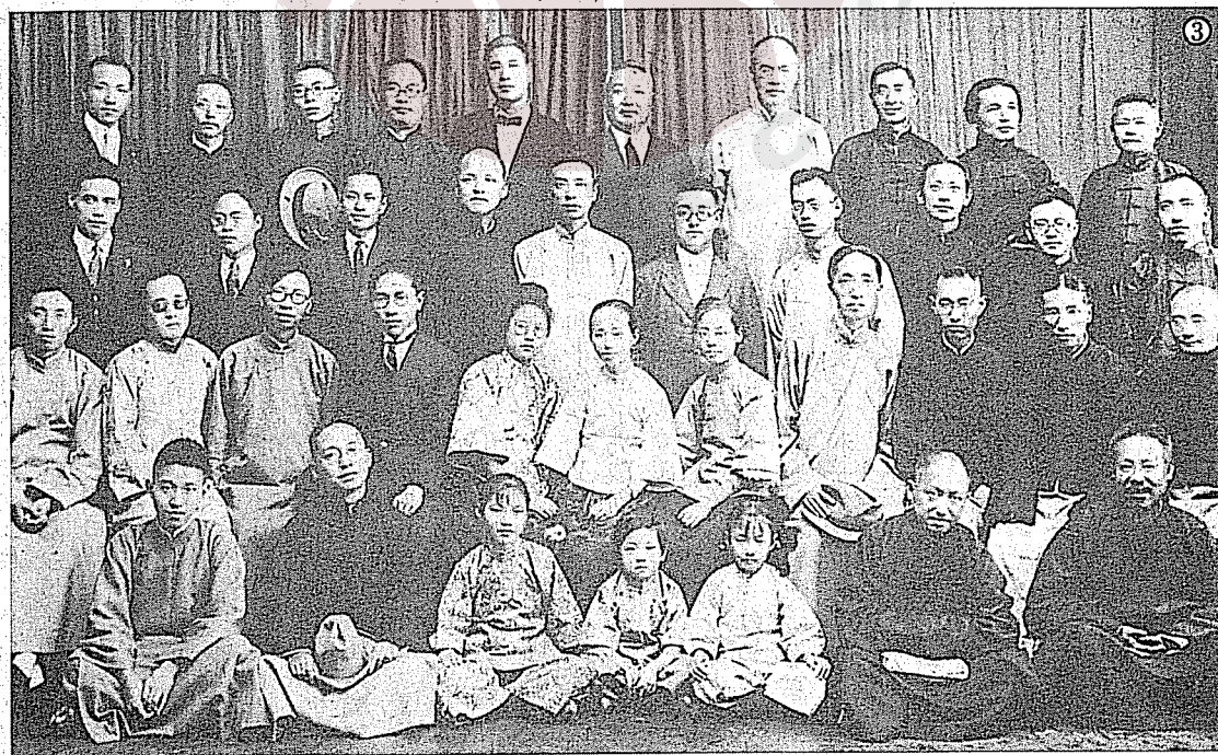
③柳亞子（前排左二）與新南社的詩人們集會時留影。