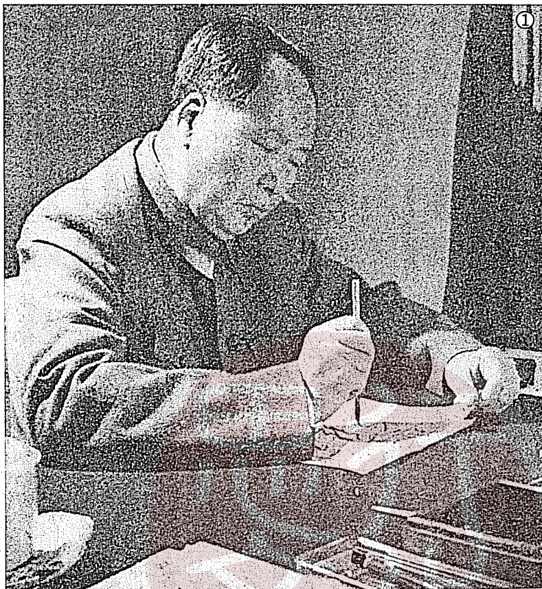
①毛澤東寫作的神情。