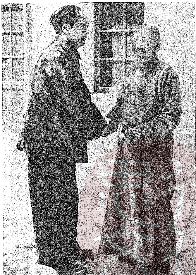
柳亞子（右）一九四九年五月與毛澤東（左）在北京頤和園合影。

了一首七律呈毛澤東：「卡爾中山兩未忘，斯毛並世戰玄黃。生才西德推賢聖，革命中華賴表章。粵海咸京堪比例，蔣凶托逆漫評量。騰歡今日新天地，澎湃潮流沸海江。」