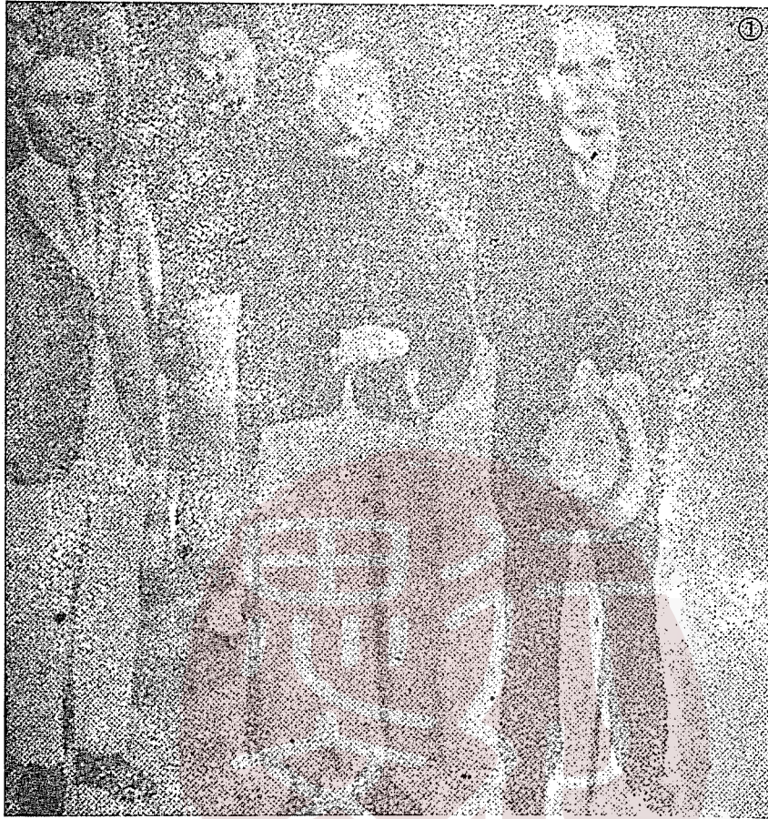
②作者郎萬法（右）與夫人在長白山上天池之畔。 ①一九二七年張作霖（右二）與日本特使梨半造（左）在北京密談時合影，右一為本庄繁。