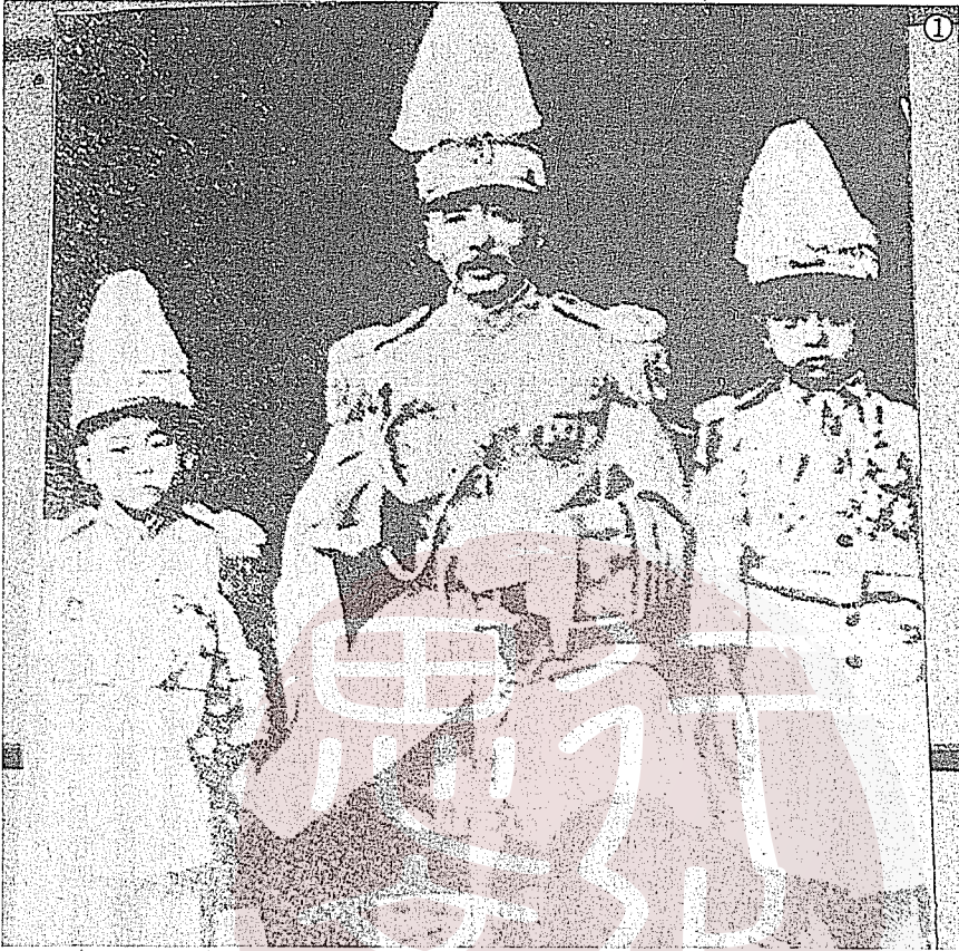
①張作霖（中）與兒子張學良（右）張學銘（左）合影。