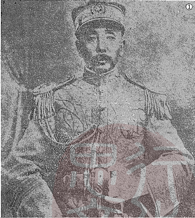
① 一九一八年任東三省巡閱使時的張作霖。 ② 一九二六年張作霖（前排右五）在懷仁堂與吳佩孚（前排右四）商討攻打馮玉祥國民軍，二排右一為張學良。