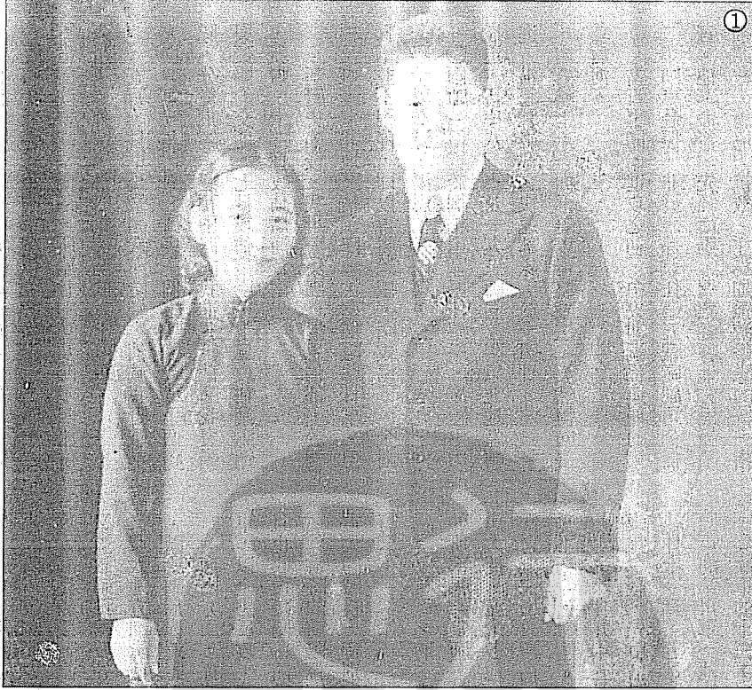
①一九三二年孫連仲（右）與夫人羅毓鳳女士（左）在廬山合影。