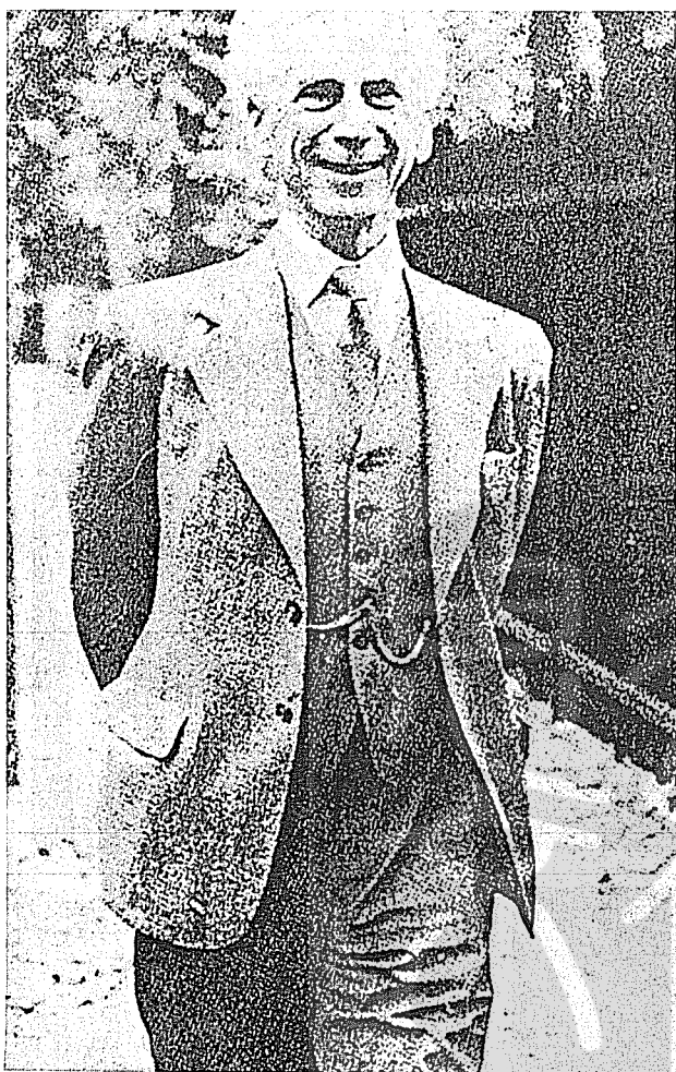
一九四〇年在哈佛時的羅素。

羅素的一生可謂多采多姿，亦是曲折跌宕，以致人們對他的評價毀譽參半。這是由於羅素思想中最突出的一點就是浮動多變，容易受人影響，也容易背棄先前的信奉。僅就他的哲學觀來說，前後經歷了絕對唯心主義，實在論和邏輯原子主義等幾大階段。其政治信仰和倫理學說也是幾經變遷，前後矛盾。羅素在《自傳》的前言中曾這樣說：「簡單而又無比強烈的三種激情主宰了我的一生：愛的渴望、知識的追求以及對人類苦難不能遏制的同情心。」但不論怎麼說，羅素無疑是二十世紀西方影響最大的一位哲學家，所以在他生前死後，論述他的思想和行爲的文章非常之多，據統計其數量可以同論述拿破侖的文章相比。