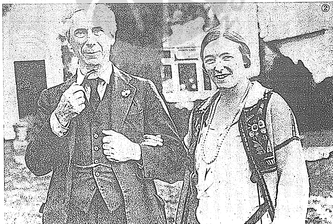
②羅素與第二任妻子勃拉克。