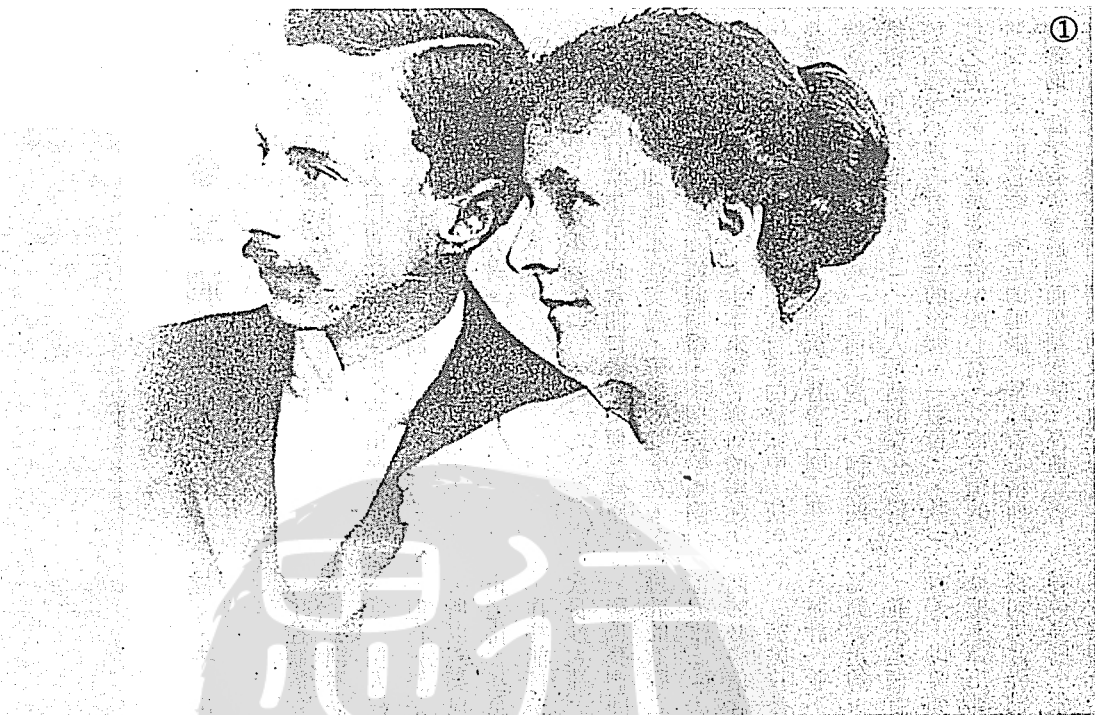
①一八九四年羅素與原配阿麗思合影。