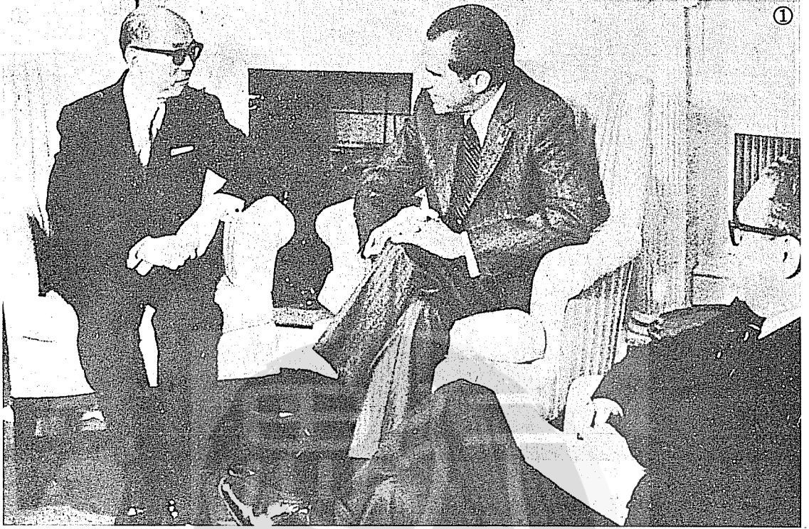
①嚴家淦（左）早年訪美與美總統尼克森（中）在白宮會談，右為季辛吉。