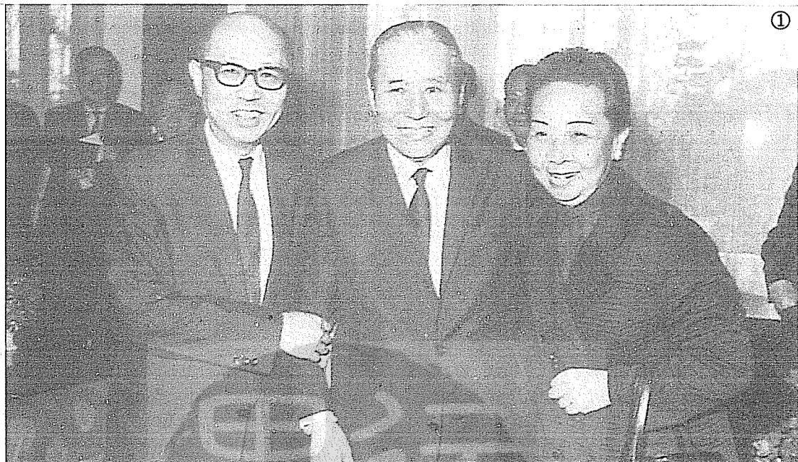
①嚴家淦夫婦（左、右）與張群（中）合影。