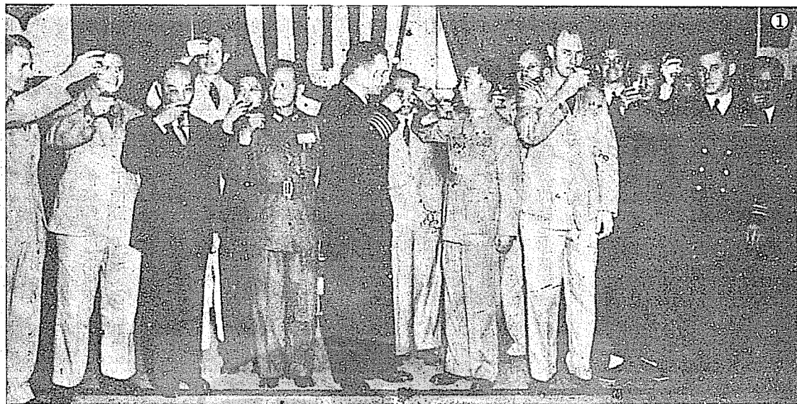
①戴笠（中右）早年招待外賓時的神情。