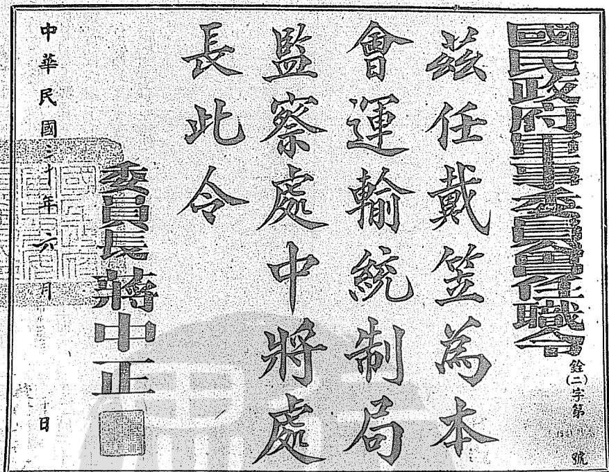
①戴笠奉派任運輸統制局中將處長的任職令。