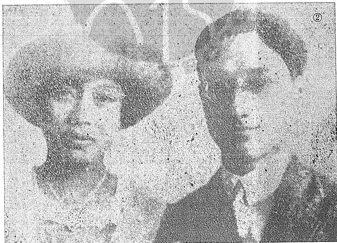
② 徐志摩與原配夫人張幼儀合影。