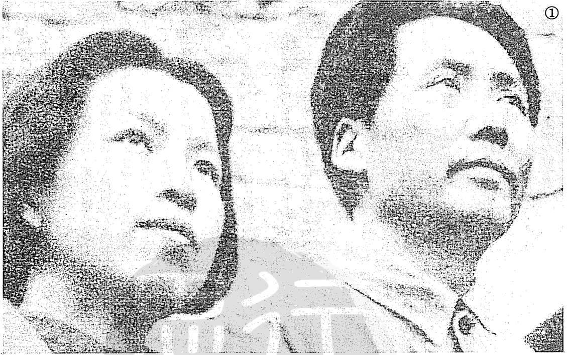
①毛澤東(右)與江青(左)早年合影。