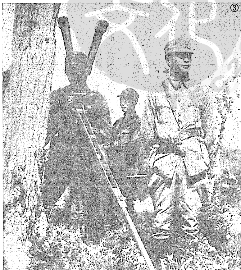
③ 八十七師二五九旅旅長孫元良親臨前線視察陣地。