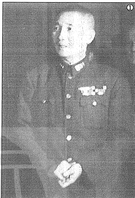
① 淞滬抗戰第五軍軍長張治中將軍。