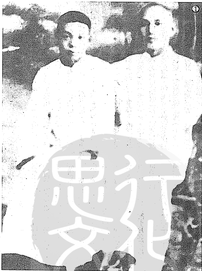
① 蔣經國（左）少年時期與父親蔣中正（右）合影。

近人撰文提到中央派人在蔣經國身邊擔任貼身警衛，那些人可能就是侍從室派去的，或是侍從室的內衛單位派去的。戴笠還不夠資格派人去保護蔣經國，基於此故，文中提到的陳達，不管他是否是侍從室派的？他如是軍統的人，是查得出來的。（未完待續）