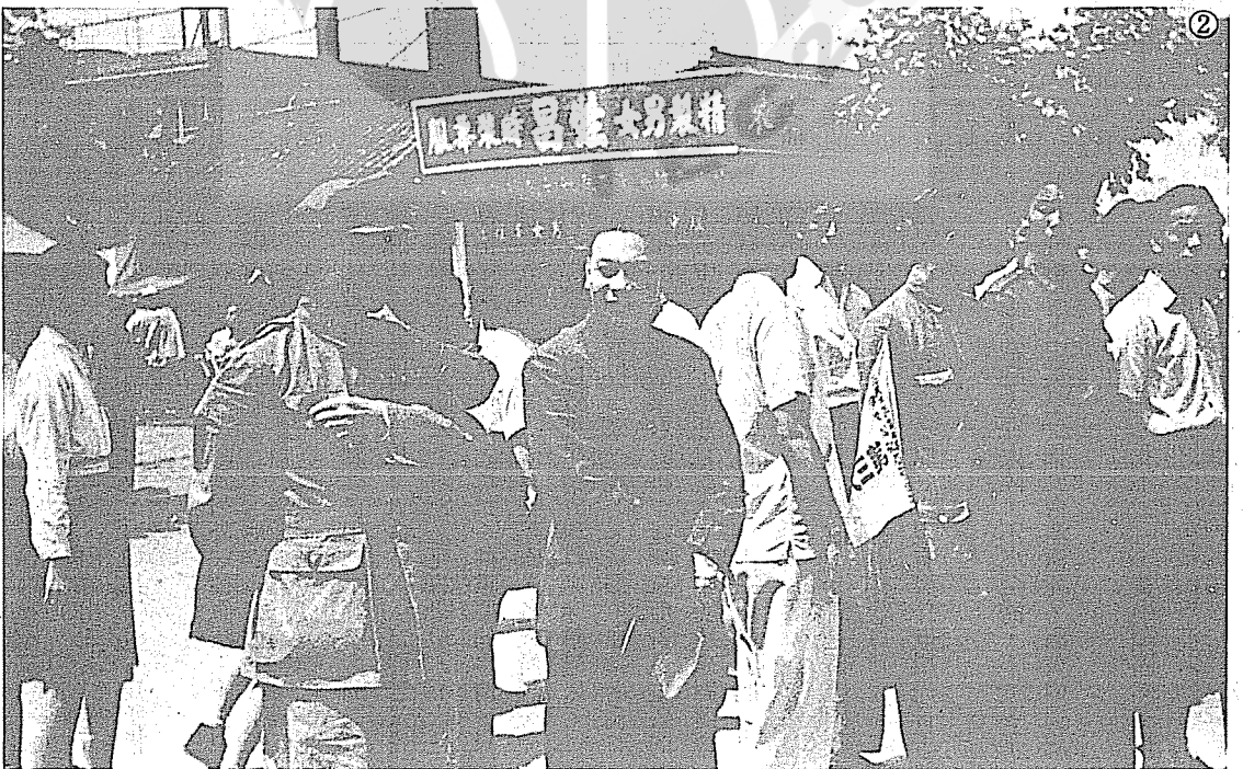
② 蔣經國（右六）在南京歡迎復員青年軍。