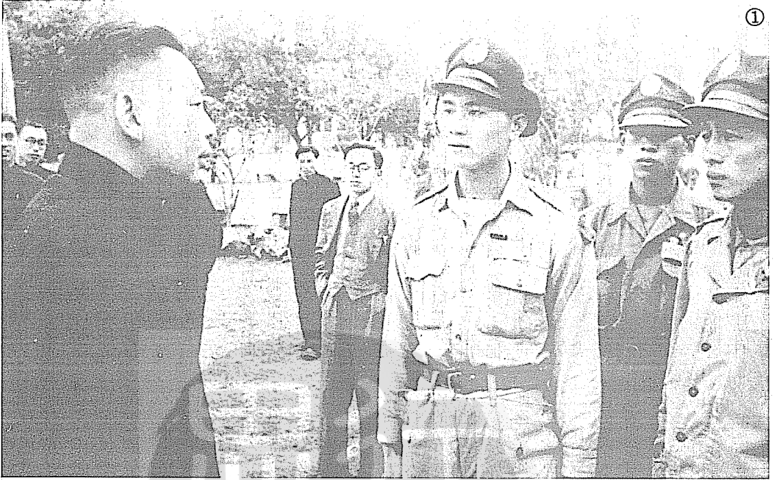
① 蔣經國（左）早年勗勉退伍青年軍。