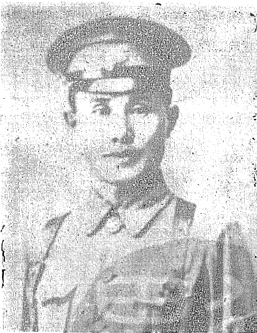
本文作者任黃埔校軍教導第一團團長參加棉湖戰役時留影。

遂下定決心，迂迴作戰，一方面在松口河岸，配置部隊，佯攻敵軍；一方面以主力於十月十日拂曉出敵不意，迂迴敵後，圍攻永定之敵軍司令部及其直屬部隊。激戰至下午五時，大破敵軍，佔領永定；周蔭人於午後四時，率親信十餘人越城逃遁，公文函電，委棄於地，辦公桌上請接電稿，墨蹟未乾，足徵其倉皇出走的狼狽情況。十三日，我乘勝指揮各軍繞道峯市，以三路圍攻松口，大破敵軍，於十七日佔領松口。兩次戰役，前後不過一週，擊潰周蔭人全部敵軍，虜獲步槍四千餘支，砲十餘門，俘敵師長李寶珩及團營長五十餘人，士兵四千餘人。此次戰役，屬於迂迴戰與奇襲戰，史稱松口大捷，而其關鍵實在於對永定敵軍司令部及其直屬部隊的奇襲。頗合乎孫子「五勝」之道中之「以虞待不虞者勝」，以及「因敵制勝」等作戰原則。這次迂迴戰的勝利，是屬於「奇」的戰爭法則。