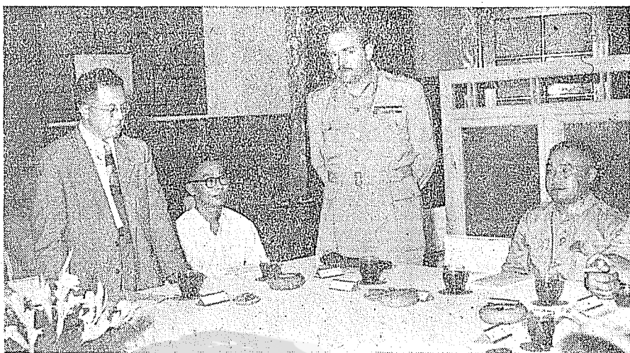
一九五七年（民國四十六年）台灣保安司令部副司令李立根中將為外賓馬赫將軍舉行會報，馬致謝詞，由本文作者翻譯。