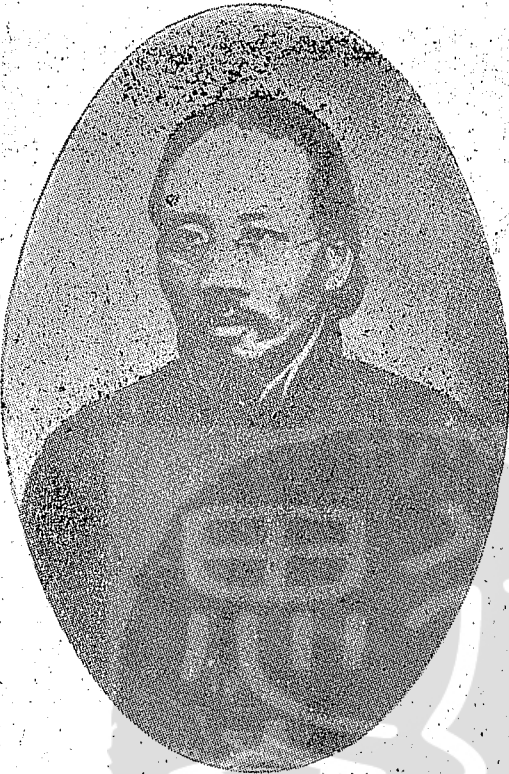
民國二十年十月在國民政府大禮堂廣場對請願學生講話的中央大員蔡元培先生。

回到北平，天氣漸寒，正是埋頭讀書的理想環境，白天可在圖書館用功或上課，每晚照例到