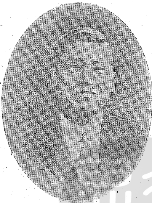
青年時期的李承晚就讀於普林斯頓大學時留影。

李承晚三歲時，舉家再度遷回漢城，並在南郊的桃村定居。那裏是平民區，有貴族血統的李承晚，從此就在平民中成長。漢城氣候甚佳，不但是四季分明，各具情緻，而且乾燥無風，春日百花競艷，秋季紅葉滿山，使人不由得喜愛大自然，以是人人愛好戶外活動，健壯活潑，通達樂觀。李承晚終日與平民兒童為伍，登山郊遊，滑雪溜冰，鍛鍊了一副堅強的體魄。