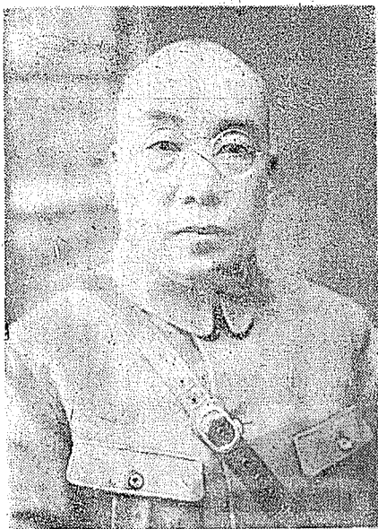
鎮嵩軍首領，同盟會會員劉鎮華。

，又畢業於保定優級師範及北京法政大學法律系，在開封辦理中州公學，可以說是一個純粹的文人。但是他胸懷大志，有意革命，乃參加同盟會，在河南密謀起義。當辛亥武昌義師發動之時，回至豫西，招集嵩山一帶的游俠綠林，編組成軍，以圖響應。和河南省民黨人士楊勉齋、劉粹軒、石幼蹇，以及綠林豪俠丁同聲、張治公、王天縱、憨玉琨、柴壽亭等相結合。接受秦隴復漢軍東路都督張鈞之約，回到潼關，參加陝西革命的軍事行動。入陝後，與張鈞所部會合，抵抗清廷派來之北洋軍趙倜（民國七年曾任河南督軍）、周福麟等部，轉戰於潼關、陝州間。共和告成，部隊整編，張鈞所部兵額較多，編為陝西陸軍第二師，尙難全部容納。乃請命當局，將其編餘部隊，連同劉鎮華原有人馬，合編為鎮嵩軍，以劉鎮華為統領。下轄步兵兩團、騎兵一團、砲兵一營，共有三千餘人，駐防潼關、華陰一帶。不久，奉調豫西剿匪，移駐陝州，消滅流竄數省的白狼殘部，戰績頗著，勢力漸充。民國