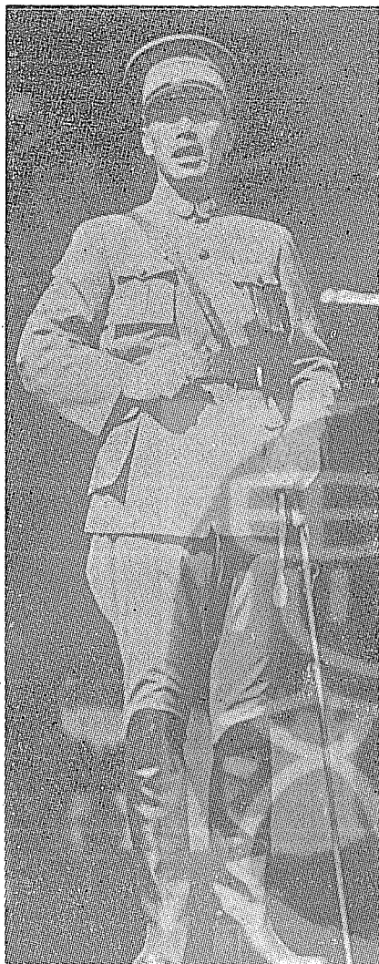
民國十八年，蔣公在慶祝北伐勝利週年紀念大會上致詞。

革命軍蒞臨永泰之時，筆者方就學於中華基督教會所創辦的私立永泰格致學校，以學生自治會會長身份，追隨各界父老，列隊恭迎 蔣公於基督教青年會大廣場。我初次獲見年方三十二歲英勇的粵軍司令官，神采奕奕，體格健碩，莊嚴威武，其目光炯炯，掃視全場，向羣衆揮手的英姿，留下永難磨滅的印象，其諄諄訓誨的話語，引起聽衆熱烈的掌聲，演講完畢，與父老及各界代