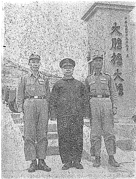
民國四十八年農曆除夕作者(中)在大廳與官兵共渡春節時留影。

「砲戰期間，我在澎湖辦公桌上，忽然發現調戍金門的命令，當即作履新的準備，在同僚中，有人打趣說道：「你從台灣來此風砂地區，過了三個冬季，走遍廿一個有人離島，如今竟又漂洋過海，調戍烽火前線，願你斬將奪旗，再渡海入廈門，繼續前進，收復河山！」我對他們的關愛，報以感激的微笑。並心嚮往之，希望總有