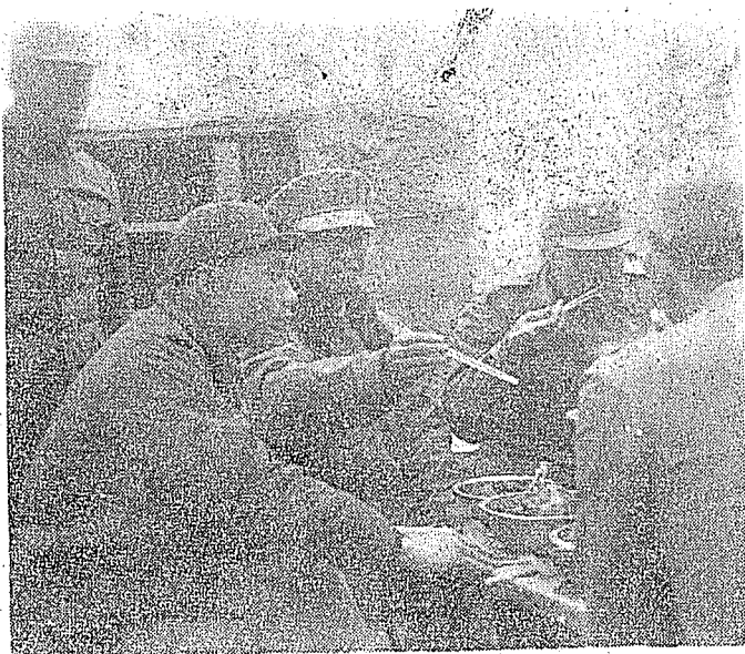
本文作者(中)偕大胆指揮官在海岸碉堡與戰士同吃年夜飯時留影。

找到行李，搬入我的辦公室寢室而又具碉堡設備的房舍中，拜見長官，接觸同事，開始我的正式工作，兩週就把我由一位新兵訓練成老兵，戰地訓練的效果如此大，這就是我成金工作的開始。