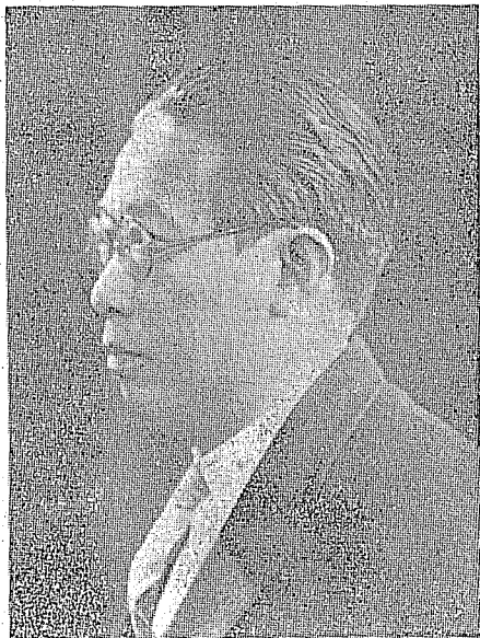
北京大學中國文學系教授兼國學研究所長沈兼士先生。