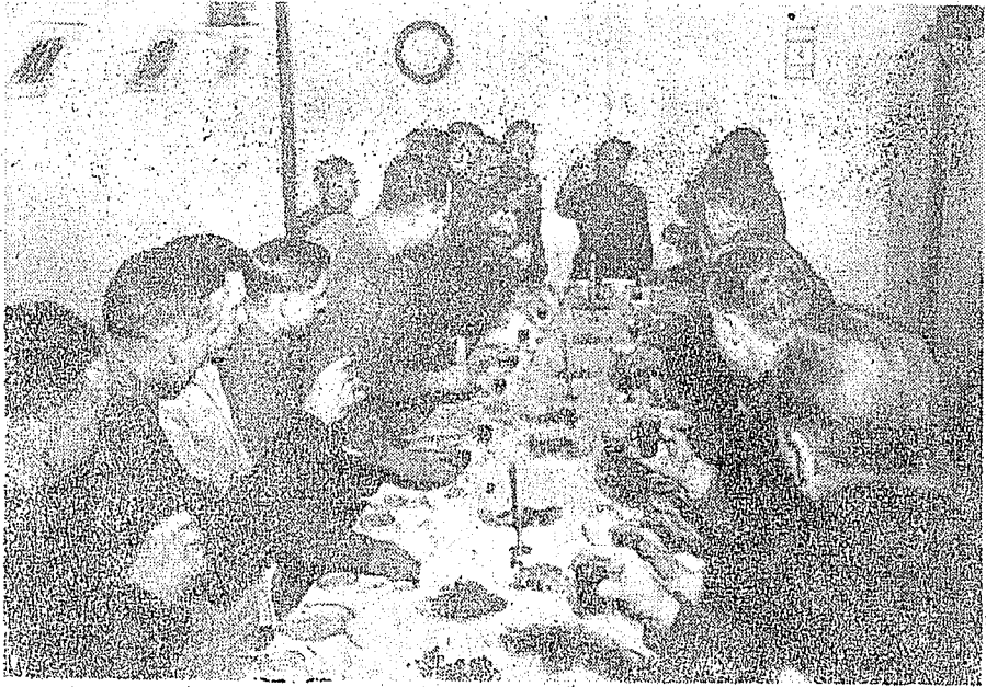
戴笠將軍招待中美情報官員時留影。

續斐然！我經常以函電向戴先生報告；他也時常有親筆函件來指示、勉勵、督導；熱情洋溢，上下同心。此時特警班無論在士氣、建設、操課各