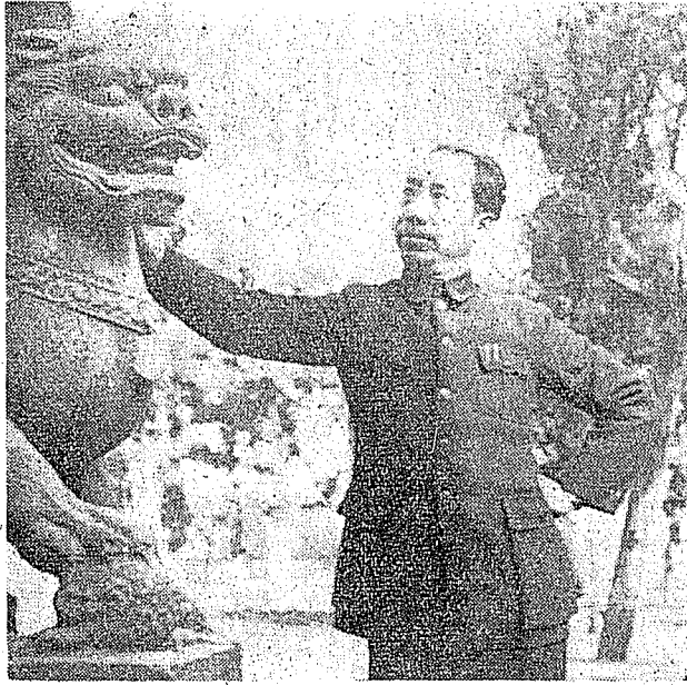
抗戰時期的戴笠將軍。

畢業典禮舉行了，總隊長陶一珊報告人數後，大家肅立，靜聽戴先生訓話。他對畢業學生多所勉勵，並且以閩女出嫁作比喻，由溫和而嚴肅，把「施衿結褵」之義，發揮得淋漓盡致，語重