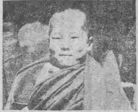
喇賴達 (任現即) 世四十第藏西 片照的時年幼珠登木拉嘛