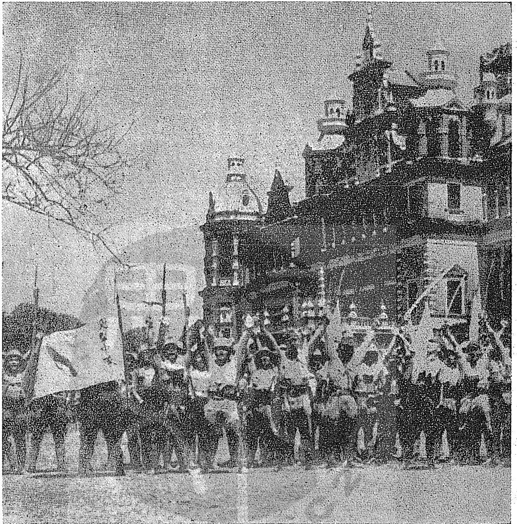
歡躍跳，前府督總在，陷攻光仰邑首將，緬入驅長，獷獨不好軍皇，年當想」 百本日，間眼轉，域異威揚，兒健華中，年三十三國民，也去春水流花落則然。忬 。片照史歷的貴珍極頓一是這：註者編 「！滅寂消烟諸付，師雄萬

並將緬甸北部敵軍全部肅清。民國三十四年二月二十三日，新三十八師主力沿中印公路兼程南下，新三十師及新三十八師之一部則在公路兩旁翼護。二十六日，中路前鋒攻克鬧亭，繼續向拉秀進迫。右翼的新三十八師一一三團連克卡康姆、南道，然後以最高速度渡過南拉河。二十八日該部攻下曼提姆，再向左旋迴攻擊，捕捉敵軍主力，展開一場血戰。左翼我軍的圈子比較兜得遠些，他們——新三十師八十八團直奔東南攻克了漢杜。正面進襲的中路，則在進佔鬧亭以後，藉重砲及戰車之助，連下要隘拉秀及芒利。 三月二日，中路大軍進展神速，朋朗、溫塔不戰而克，三日又拿下了曼牧，尤且大舉南下，攻略南育河畔。五日傍晚，新三十八師主力再出奇兵，神不知鬼不覺的由他旁潛渡，然後啣枚疾進，一舉進據老臘戍，時在三月六日凌晨。此時，左右兩翼大軍亦已先後渡過南育河，分頭進逼印愛、滙約。敵軍在緬北的最後據點，全已陷入重圍。 三月七日，中路大軍攻克臘戍火車站，八日，以瓜分豆剖，摧陷廓清之勢，將臘戍的日本守軍全部肅清，這一仗直殺得日軍殘餘主力血流漂杵，