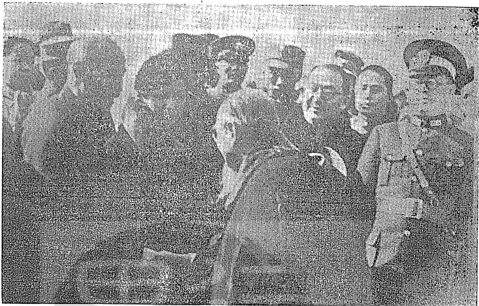
民國二十五年十二月二十五日，全國軍民萬眾騰歡聲中，蔣委員長偕夫人平安返抵首都南京，國民政府主席林森親蒞機場迎候，向蔣委員長握手道賀，在林主席右側者為行政院副院長長孔祥熙。