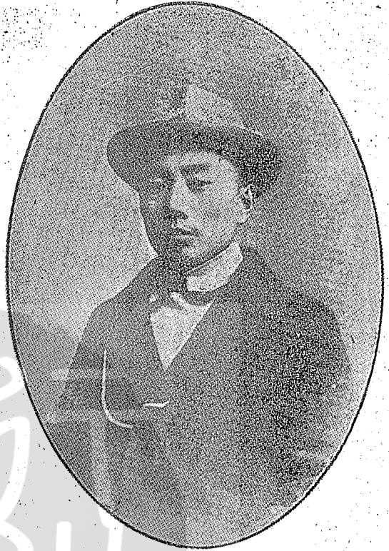
中華民國第一任警察總監吳忠信