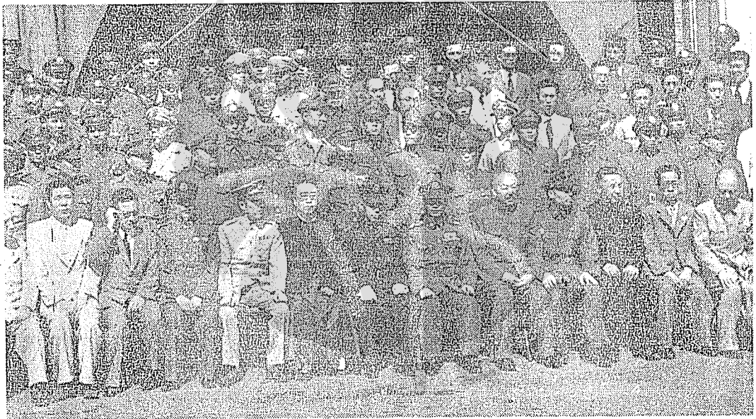
民國三十六年九月二日陳誠與熊式輝交接東北行政主任後留影，第一排右起：韓俊傑、吳煥章、吳濤、張作相、陳誠、熊式輝、王樹翰、鄭洞國、熊式輝自難辭其咎矣！茲謹就筆者所知，就勝利後熊式輝在東北情形憶述如后：

自從日本偷襲珍珠港美太平洋海軍基地，世界大戰全面爆發後，我國始正式對日本宣戰，遂即委派東北軍宿將萬福麟任遼寧省主席，鄒作華任吉林省主席，馬占山任黑龍江省主席，劉多荃任熱河省主席，作為我國行將收復東北失地的先聲。任命的這四位省主席，皆係一時之選，不但在東北具有號召力，在抗戰時期轉戰南北，亦頗著功勳。如萬福麟乃係張學良承繼東北軍政大權，出任東北邊防司令長官時之副司令長官，為東北軍新派之首領。鄒作華不但為東北宿將，且為全中國砲兵界元老，對日抗戰期間頗著功勞。馬占山為黑龍江嫩江大橋之役，首先擊敗日軍之名將，不但名滿天下，且為一頗富韜略善用騎兵之將領。劉多荃亦為東北軍名將。蓋我政府原期對日作戰，需經若干次大小戰役，逐步北上，然後最後收復東北領土。