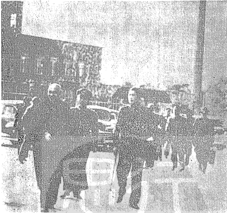
抗戰勝利後 總統蔣公巡視東北，蒞臨瀋陽。