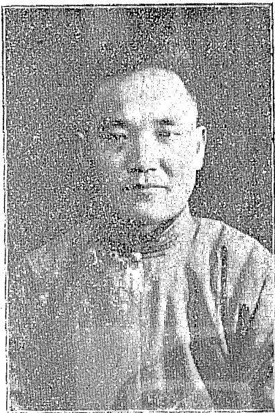
台灣省光復後第一任教育首長、台灣行政長官公署教育處長趙迺傳教授遺照。

民國三十四年十一月一日起，教育處遷入長官公署二樓辦公，展開各項接收工作，首先接收總督府文教局及其附屬機構。文教局因戰時緊縮，接收時，僅設庶務係及教學接護兩課，庶務係及屬於教學課之經理、學務、鍊成、編修各係，接護課內之社會教育部份，以及局外各附屬機構