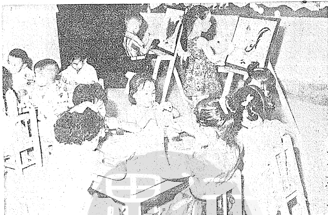
光復後臺灣的學童，在政府賢明的教育措施培育之下，一個個天真活潑。

一職，直至三十五年二月始由王石安接任。此為臺南工專（嗣改工學院升格為成功大學）首任校長發表前後的