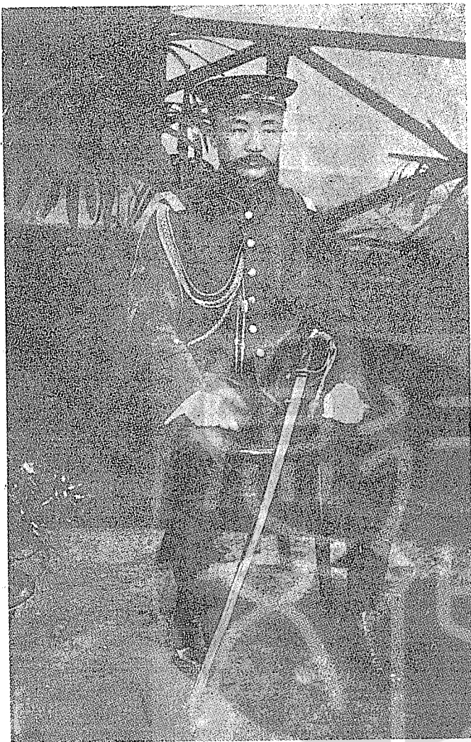
與林森、吳鐵城同時在江西起義的革命巨子，後任江西都督的李烈鈞將軍。

黃鍾瑛和他的部下軍官登時怫然變色。他們嚴詞指九江軍政府缺乏誠意，對他們一面告示籠絡羈縻，一面使用陰謀詭計，分明是在以他們為敵。因為，海軍慣例，卸下砲門便等於是宣告稱降，那將是他們的奇恥大辱。當下，黃鍾瑛和他