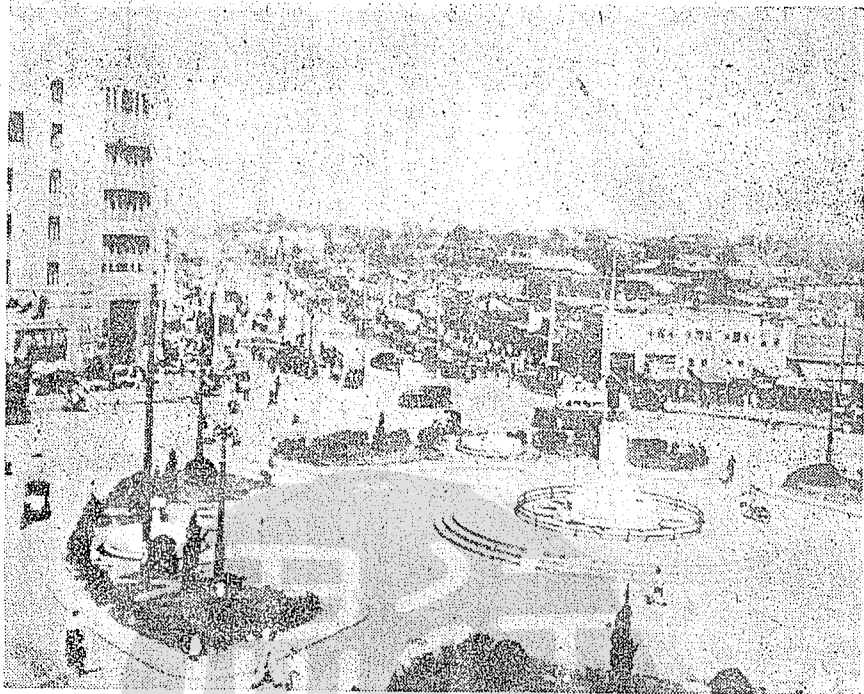
南京繁華市廛中心——新街口

以便蓄水，並隨時視水位情形開放閘門，藉資沖刷調節，用收疏導污水澄潔秦淮河水之功。該閘於民國二十四年完成，頗收預期的效果。至自來水廠原屬於工務局，後來劃歸市府直轄。因當年人口激增，自然而然的需求和用水量也與日俱增，所以有擴大的計劃。今日臺大校長閻振興先生剛從清華大學畢業，作旅行參觀，曾陪往巡視新建濾水池等設備，閻氏至今尚津津道及也。