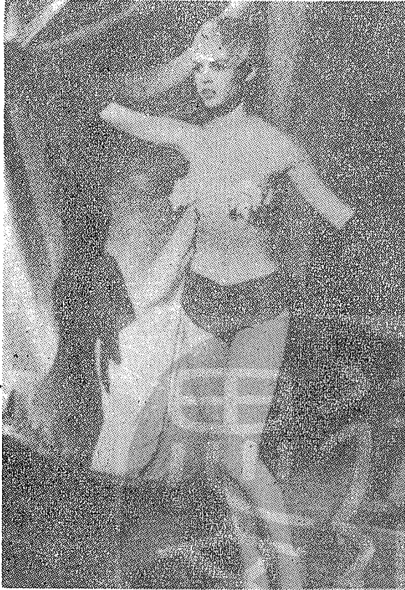
艷星碧姬芭杜向世人炫耀她的性感魅力。

B B跟夏美里爾熱戀時，有一次她在臥室公然和夏美里爾作「警幻仙子所訓的事兒」時，不慎被B B的丈夫羅吉爾撞見。於是，羅吉爾盛怒之下，攔了夏美里爾一記耳光，並向法院控告B B，他向法院上說：「我親眼看見，她對我做出