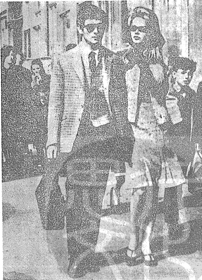
艷星碧姬巴杜與夏美里爾雙雙漫步羅馬街頭，態度大方，羅馬人都讚美碧姬巴杜確是長得迷人，不像傳說中的妖冶。

夏美里爾在軍營中的生活，很不好受，除了沒有嬌妻溫慰外；由於，軍營中的袍澤們對他有名氣的大明星太太不斷地嘲諷，不斷地侮辱，使得他的神經失常，頹唐不堪；最後，進入軍醫院接受心理治療，並獲准緩役一年。