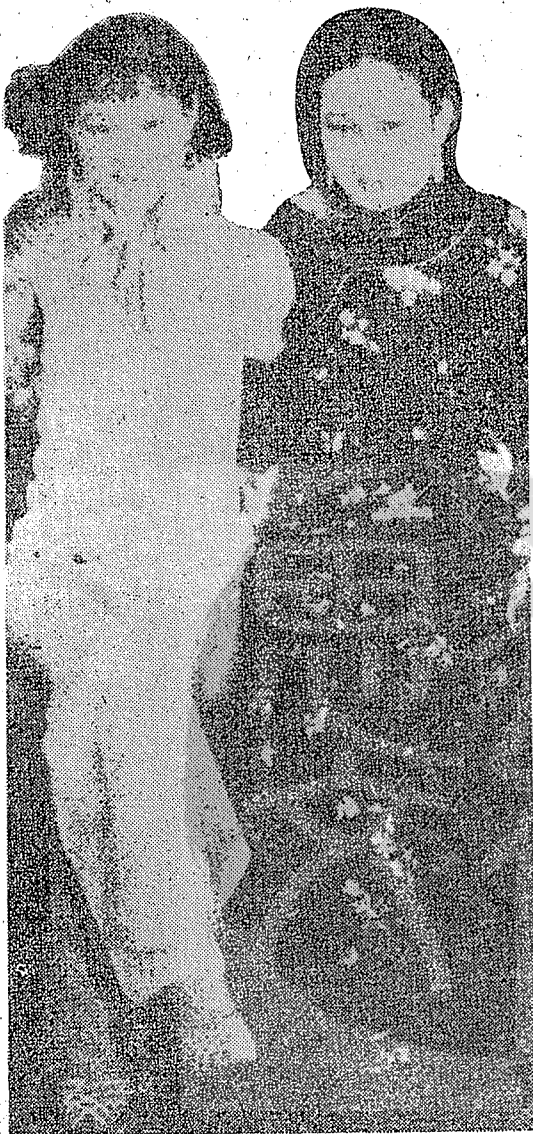
四十年前影后胡蝶(右)與影星徐來(左)合影。

遙憶四十四年前的「九一八事變」後，馬君武博士曾有哀瀋陽詩二首，其一為：「趙四風流朱五狂，翩翩胡蝶最當行；溫柔鄉是英雄塚，那管東師入瀋陽。」