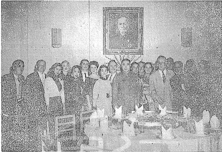
本文作者任國防部總政治部主任時與勞軍團影歌星合影。

底特律市政府所施行的公務員進修制度，為「儲備進修」。係將才能資歷合於晉等，而尚未能佔補上階懸缺之人員，保送大學夜間部有關各科系進修研讀，學費雖由學生自行負擔，而市政府另行支給「加班費」，藉以補助。密歇根州政府在施行的公務員進修制度，則又與底市的「儲備進修」方式稍有不同。密州政府的制度，可稱為「一般進修」，參加的人員，與升等無關，并且列有經費預算，惟進修人數超過了預算數額，始影響其學費津貼款額；至晉等人員，則另須參加升等考試。我對於這兩種在職公務員的進修方式，頗為心儀，回國後曾在人事行政局作簡報，力言其利，惜未為所採用。