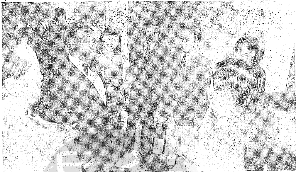
海地共和國男歌星彼得莫爾(左起第二人) 在酒會中引吭高歌，本文作者(右起第三 人)與大家佇足聆聽。