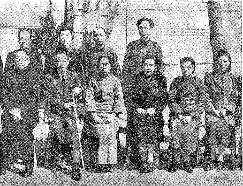
浙江省主席沈鴻烈（前排左一）杭州市長周象賢（前排左二）與杭州市參議員錢英（前排右三）褚壽康（前排左三）等合影。

正準備從事各項建設工作，可以說是抗戰以後最好的一段小康時期。這一天浙江日報所載的重要新聞，是美國駐華大使司徒雷登飛抵杭州。報紙上有他的簽名與許多照片。司徒雷登的父親於清末在杭州傳教，逝於杭州。他的母親在杭州創辦弘道女校，直至大陸陷匪，始行停辦。他父母的墳墓，均葬在西湖九里松，就是從岳墳到靈隱的道中。九里松是指沿途有九華里長，遍植松樹，人行其中，面為之綠。當地老百姓則稱司徒雷登父母的墓地為外國墳山。除他們的墳墓外，尚有其他外籍人士的墳墓，大多為在杭州的傳教士及其家屬。司徒雷登父親所傳教的教堂，在杭州東街的天漢州橋，相近有杭州最老最大的天主堂。天漢州橋事實上有橋之名，並沒有橋，左轉經過百井坊巷，可到武林門。其地距市中心稍遠，我少時曾去過。由美籍牧師明恩德