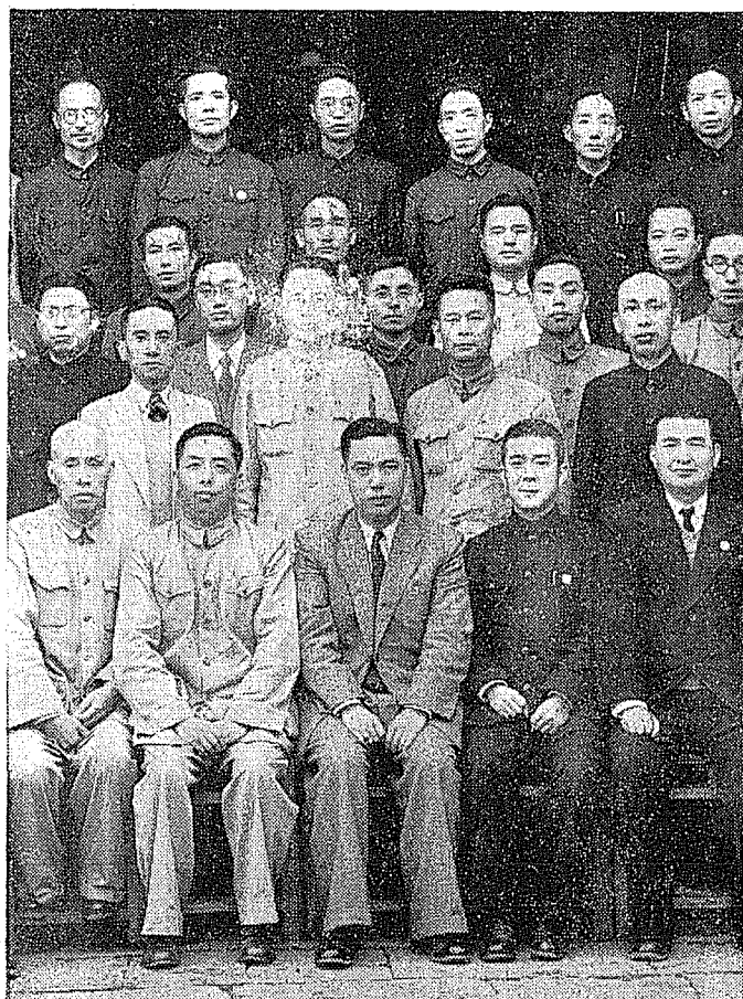
民國卅六年本文作者任浙江省政廳長兼省行政視察團團長（前排中坐者）視察嘉善縣時與歡迎人員合影。

府創辦的報紙。當時省府主席黃季寬（紹竑）喜歡訓話，每次皆是長篇大論，達二、三小時之久。他先自己寫好綱要，好像編預算似的，有項、有目、有節。并且大段之下有小段，幾點之外尚有幾點。戰時集會，人多時每在廣場舉行。無桌無椅，聽者講者皆要站立。也尚未發明擴音器，故聽者講者也皆感吃力。他總要每人帶一小本子，一面站着聽，一面用鉛筆隨手記下要點。戰時未有自來水筆，更沒有現在的原子筆，連鉛筆也算是不易得的工具。我却常不帶本子，也不記。他在台上看見，最初幾次不好意思問我。有一次，他終於問了，我乃將其所講的要點，一一複述。并將其所引的例證，有錯誤的地方，加以說明。他乃大為讚佩，認為我的記憶力與領悟力，真是難得。以後，他常在講演前，將預先寫好的綱目給我看，要我提供意見。