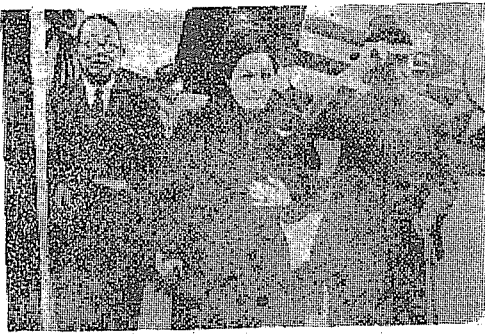
場機出陪席主沈由婦夫府主蔣

（本報訊）廿一日中午十二時二十分，蔣主席、宋夫人及隨員，由紹興乘機抵杭。蔣主席在機下檢閱空校學生，並一度赴紹興瞻謁禹陵。宋夫人亦隨同前往。蔣主席在機下檢閱空校學生時，曾與空校校長陳延炯、主任王世傑等交換意見。宋夫人亦隨同前往。蔣主席在機下檢閱空校學生時，曾與空校校長陳延炯、主任王世傑等交換意見。宋夫人亦隨同前往。蔣主席在機下檢閱空校學生時，曾與空校校長陳延炯、主任王世傑等交換意見。宋夫人亦隨同前往。