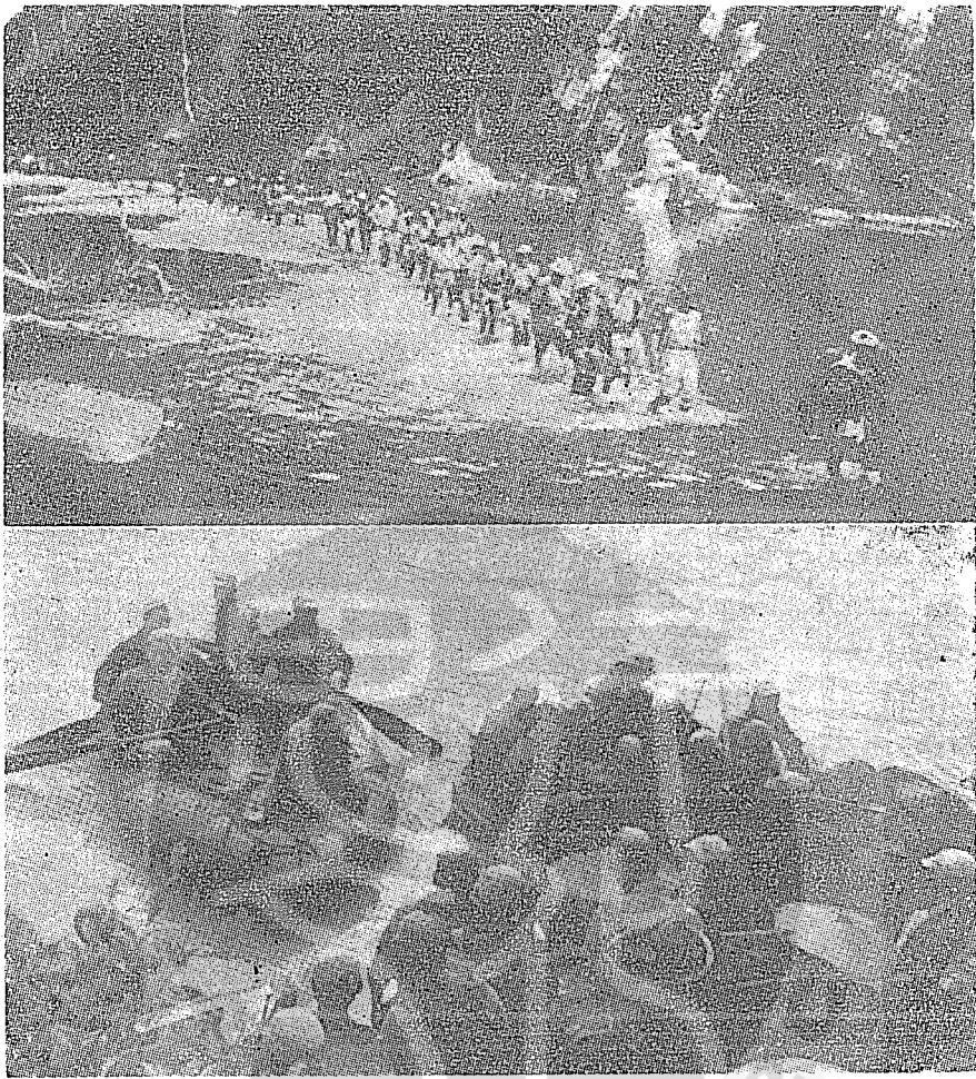
中華雄師遠征緬甸，抵抗日軍侵略。上圖為涉水行軍，下圖橡皮艇強渡怒江。

(一) 共產主義與帝國主義問題。曾經廣泛交換意見。 (二) 領土問題。雙方同意，東北四省與臺灣、澎湖羣島