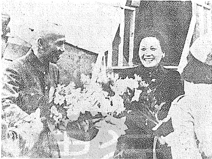
抗戰勝利臺灣光復後民國三十五年十月二十一日蔣中正主席偕夫人飛抵臺灣巡視，在台北松山機場接受學生代表獻花歡迎。

時，在南京順利完成，這是中國歷史上最有意義的一個日子，這也是八年抗戰艱苦奮鬥的結果，東亞及全世界人種和平與繁榮，亦從此開一新紀元。