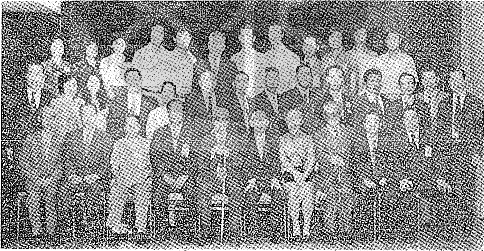
前、一拂李一左排前，影合鄉同台在南雲與(人五第起左排前)生先翰維張 。康爾簡長局總政郵為左排二，恆羅二右排